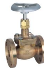
TABELA DIMENSIONAL ( K. M. )

Válvulas e componentes limpos para uso em Oxigênio, conforme CGA G4.1