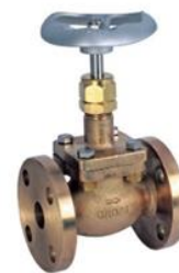
TABELA DIMENSIONAL (K. M.)

Válvulas e componentes limpos para uso em Oxigênio, conforme CGA G4.1